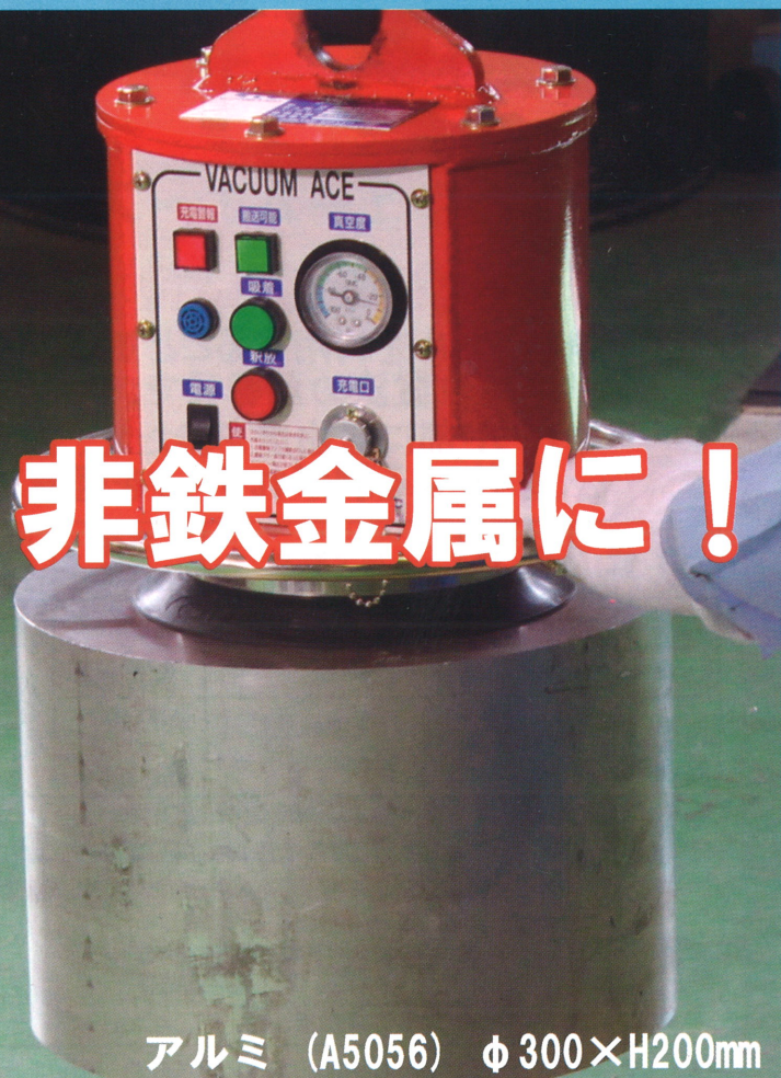
アルミ (A5056) φ300×H200mm